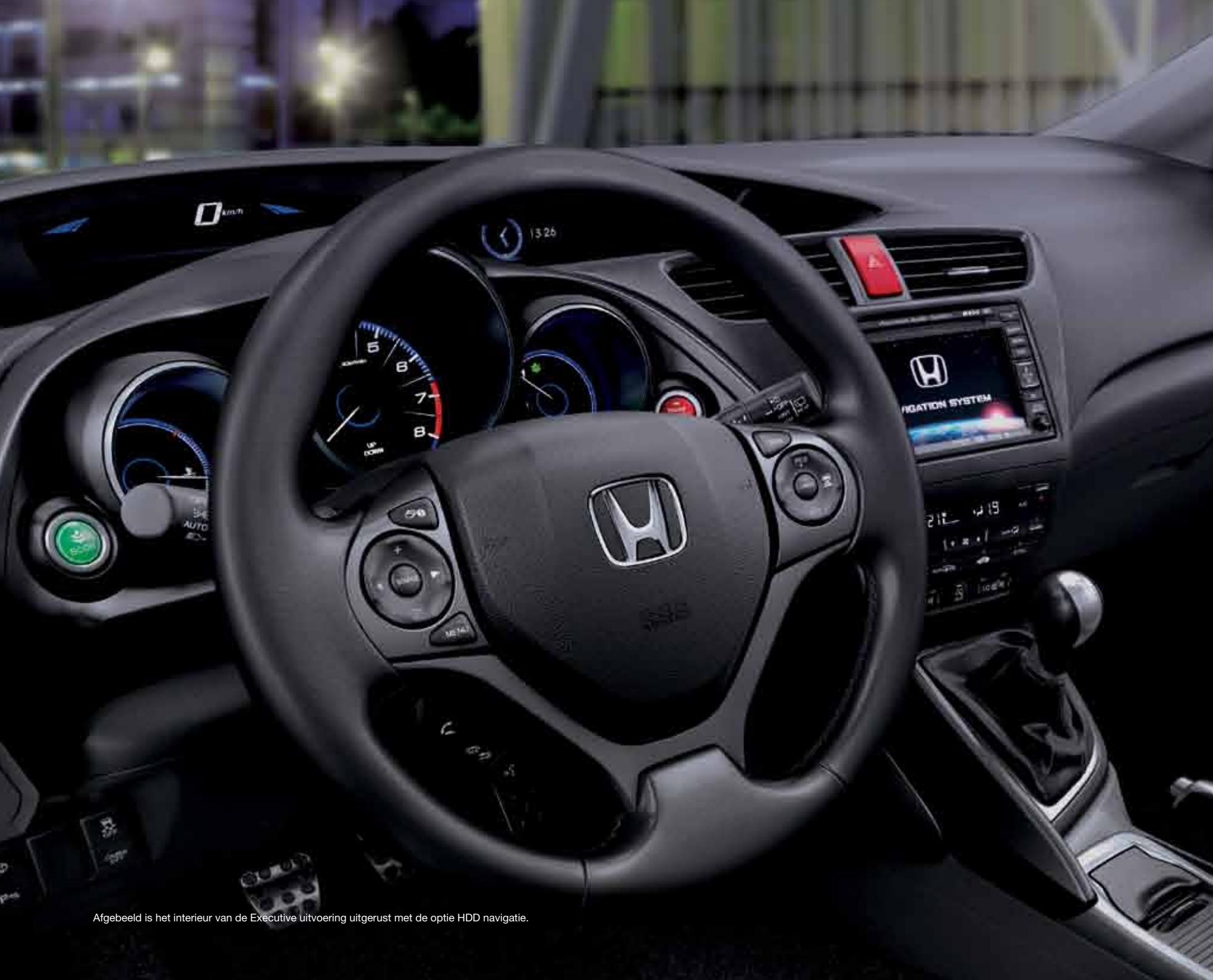
Afgebeeld is het interieur van de Executive uitvoering uitgerust met de optie HDD navigatie.