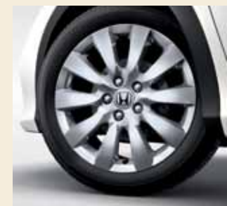
De Sport en Executive uitvoeringen zijn standaard uitgerust met 17" lichtmetalen velgen