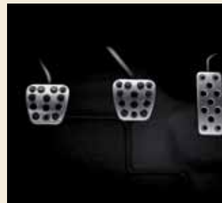
Geperforeerde aluminium sportpedalen zijn standaard op de Sport & Executive uitvoering