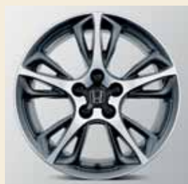
De Hydrogen 18" lichtmetalen velg