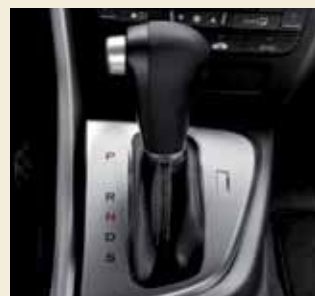
Een comfortabele 5-traps auto-maat met schakelflippers aan het stuurwiel is optioneel voor de 1.8 benzineversie