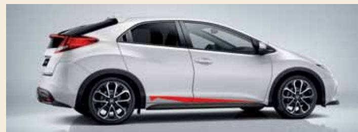
Senna Always One