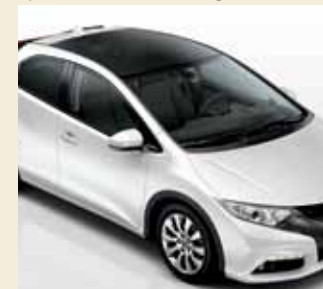
Een panoramisch dak is standaard op de Executive uitvoering