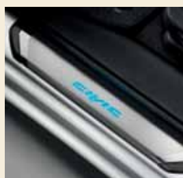
Instaplijsten, met bij de voorportieren een blauw verlicht Civic logo