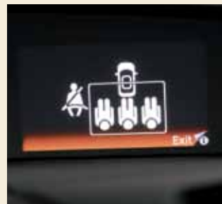
Het i-MID informatiescherm (5") toont onder andere informatie over brandstofverbruik, audio en climate control