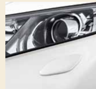
Bi-Xenon verlichting met wasinstallatie en Highbeam Support Systeem is standaard op de Executive uitvoering