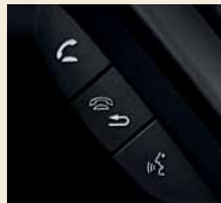
Handsfree bellen via Bluetooth ® is standaard op de Executive uitvoering