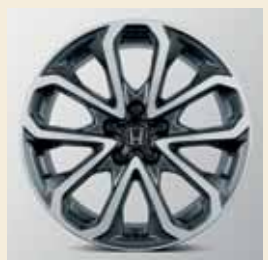
De Krypton 18" lichtmetalen velg